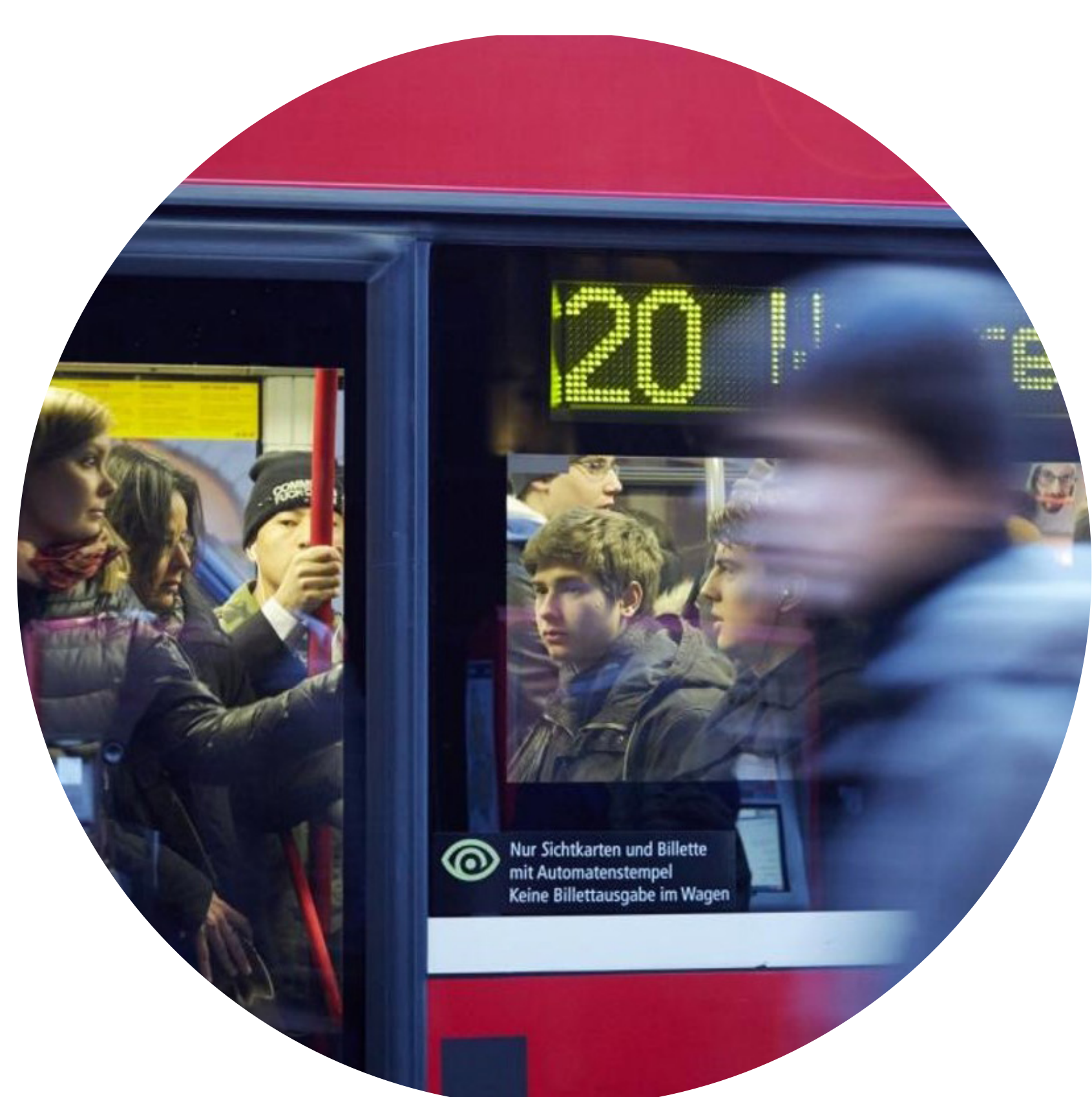
Unterrichtszeiten in Schulen flexibel gestalten

Wo Gemeinden selber Mobilitätsanbieter sind, müssen sie sich aktiv mit den möglichen Szenarien und mit den Mobilitätsbedürfnissen ihrer künftigen Kunden und Kundinnen auseinandersetzen – z.B. beim regionalen öV.