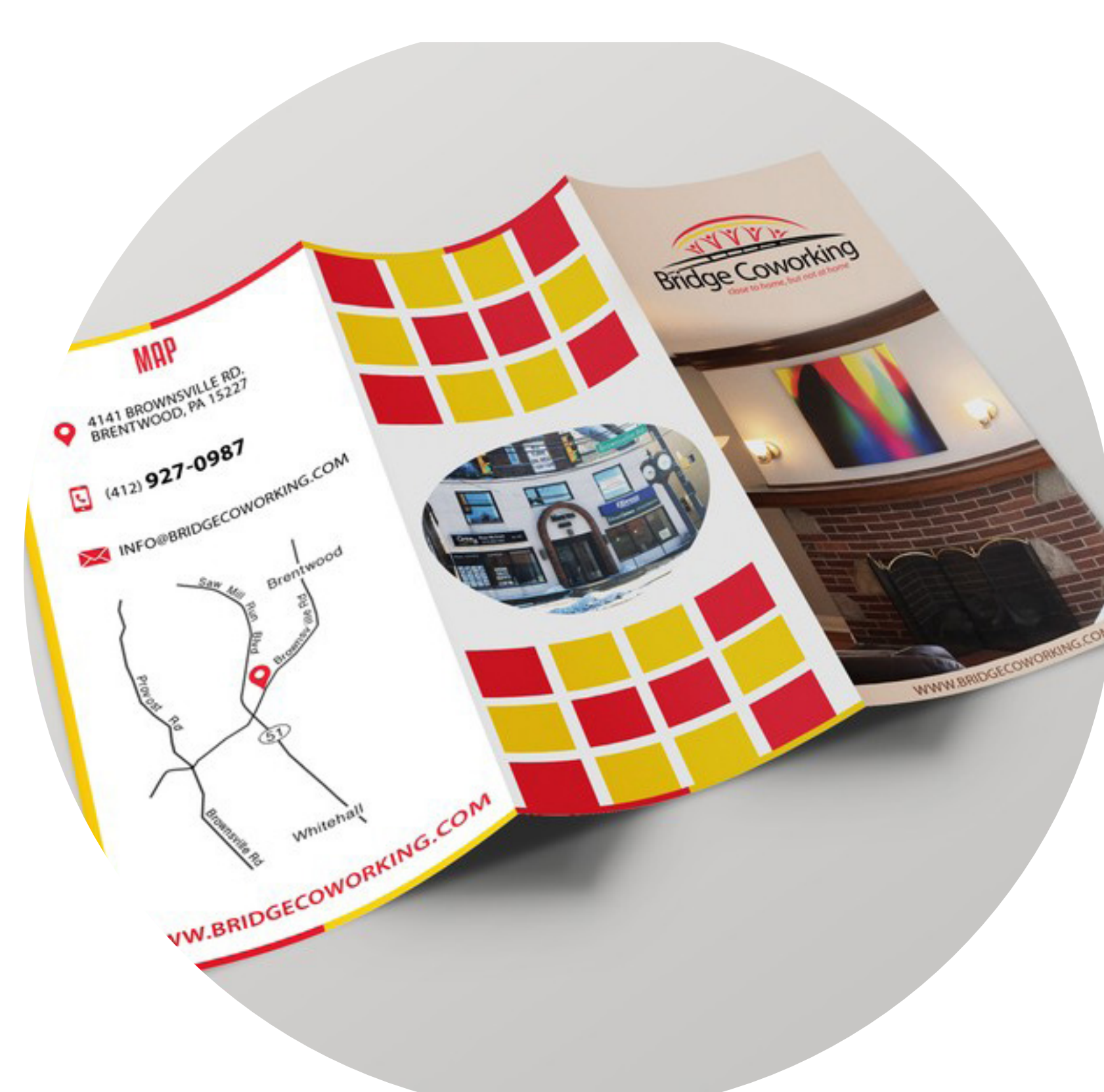
Über bestehende Möglichkeiten für Coworking in der Gemeinde oder Region informieren