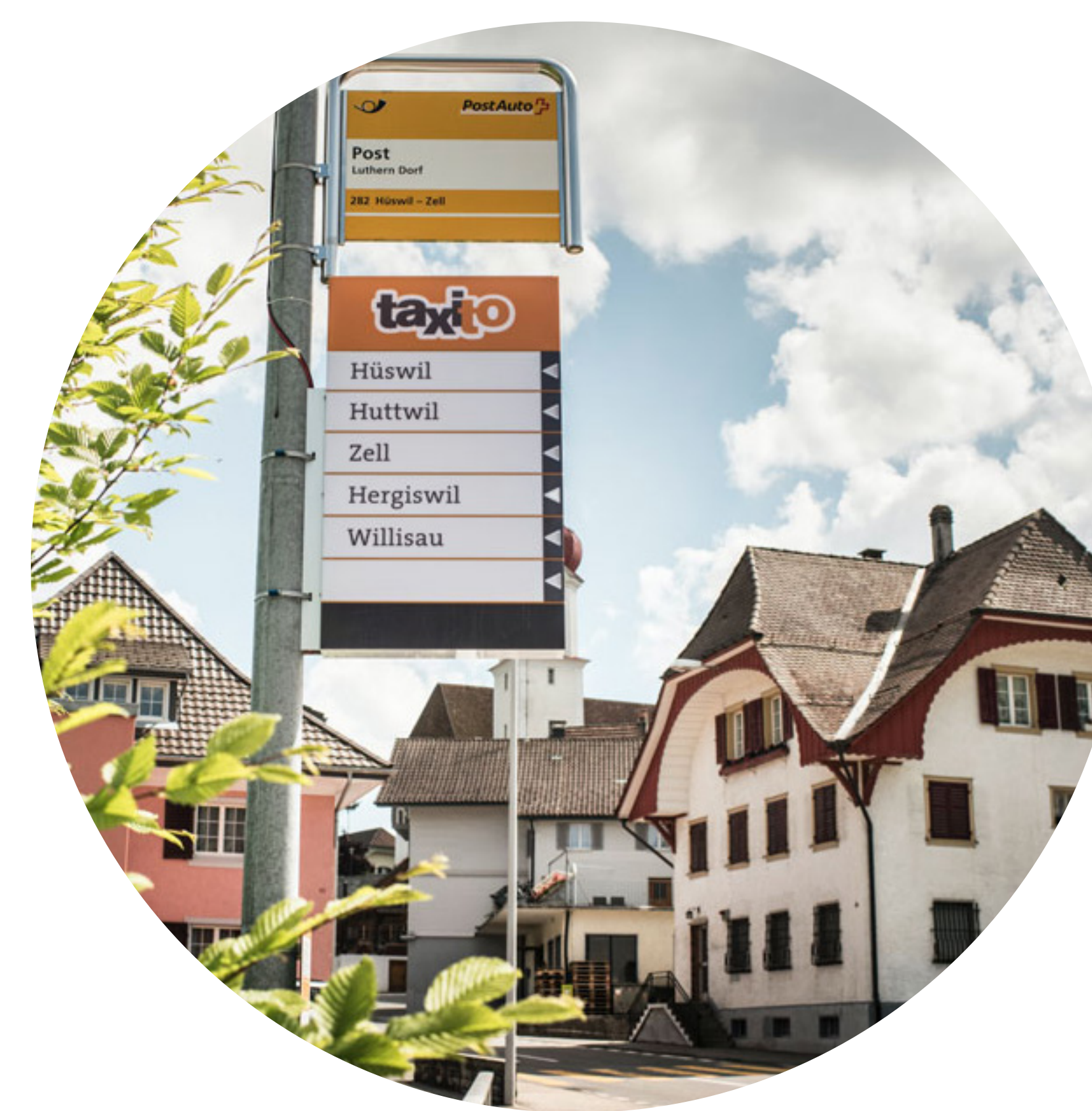
Ein regionales Mitfahr-system aufbauen