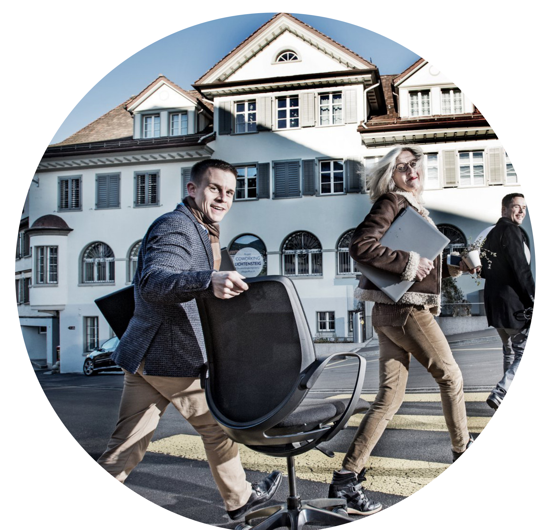
Einen Coworking Space in der Gemeinde bzw. Region aufbauen