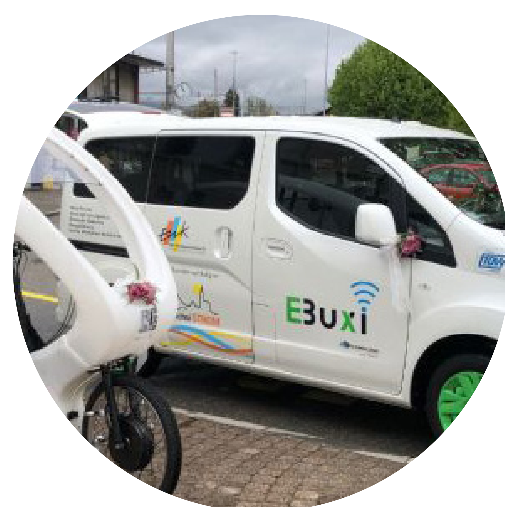
Ein flexibles und bedarfsgerechtes Tür-zu-Tür-Angebot etablieren