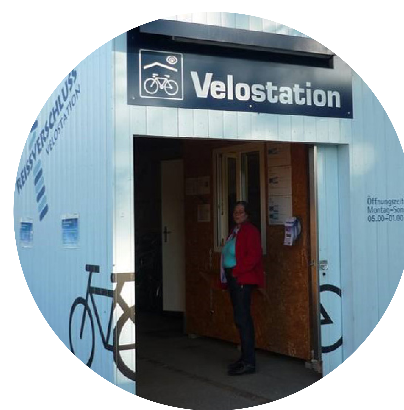
Komfortable und sichere Veloabstellanlagen anbieten