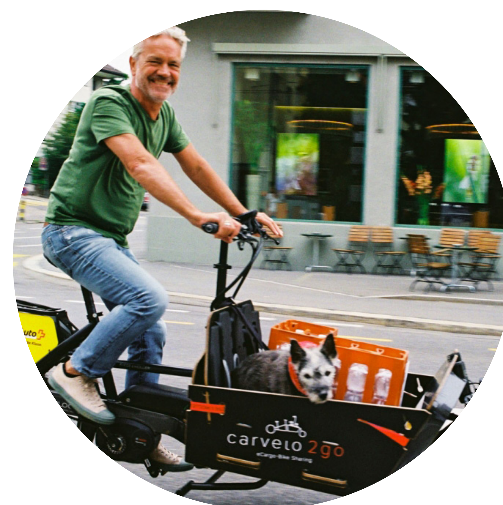
Verleih von Cargo Bikes fördern