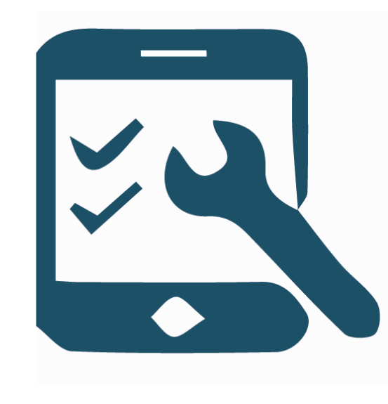
Infrastrukturen schaffen und Dienste anbieten