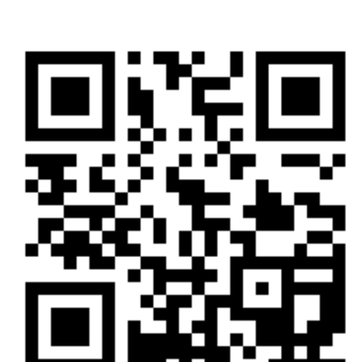
Best Practice Carvelo2go: Sharing von E-Lastenrädern