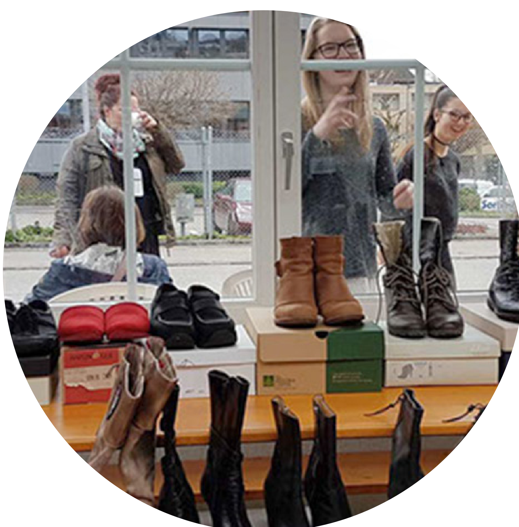
Bewussten und suffizienten Konsum fördern