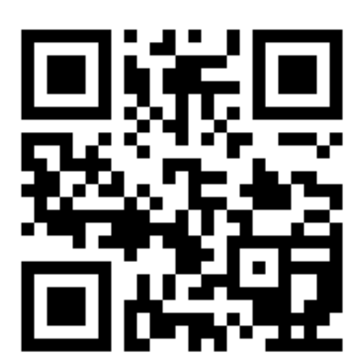
Best Practice taxito im Lutherntal