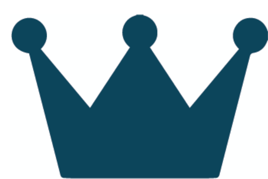
Als Gemeinde Vorbild sein