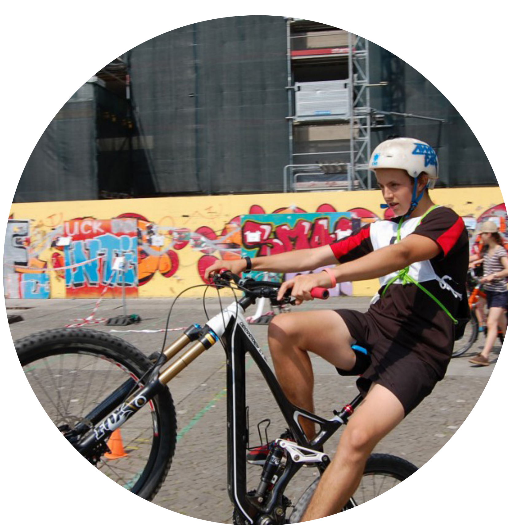
Kinder und Jugendliche auf den Verkehr vorbereiten und zum aktiven unterwegssein motivieren