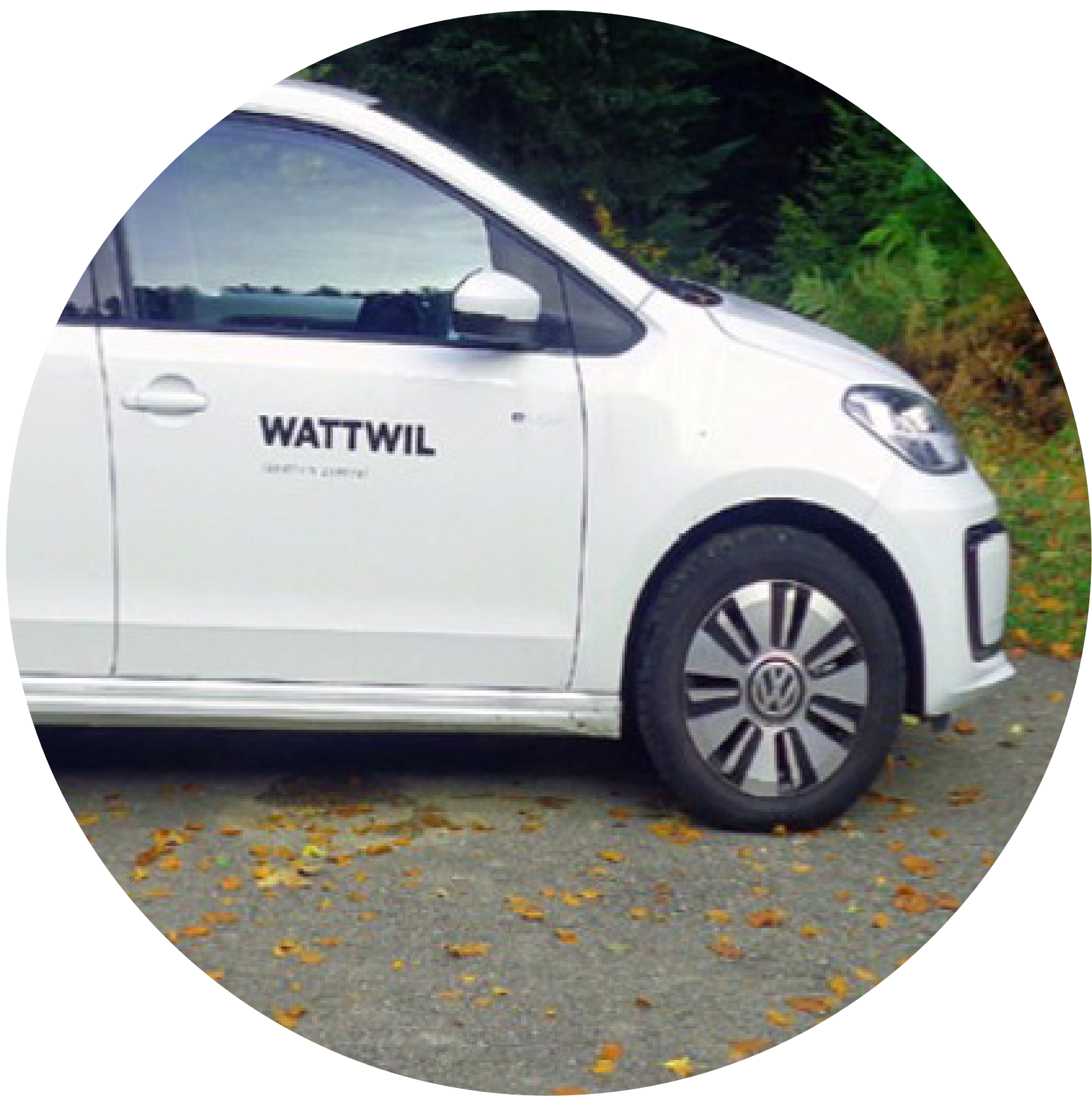
Die Fahrzeugflotte auf Elektromobilität umstellen

Elektrofahrzeuge sind effizient, leise und klimaschonend, brauchen aber entsprechende Infrastruktur. E-Bikes machen fit und garantieren einen attraktiven Aktionsradius.