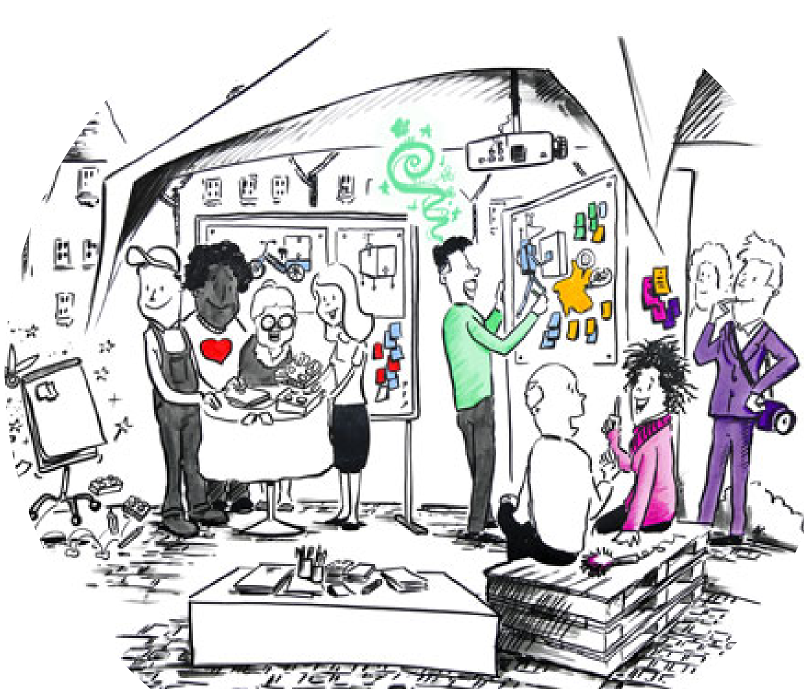
Testumgebungen für die Mobilität von morgen schaffen