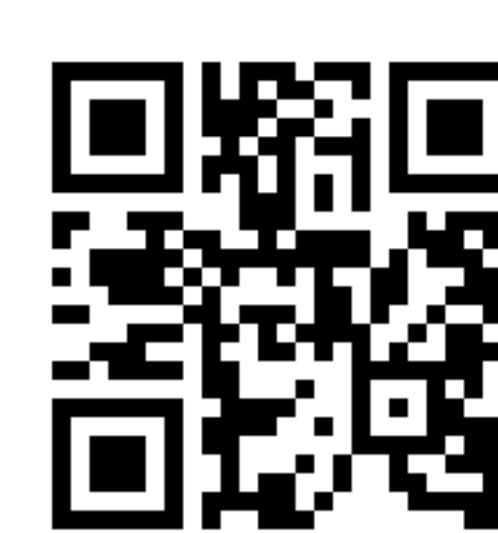
Best Practice Hauslieferdienst der Stiftung Intact