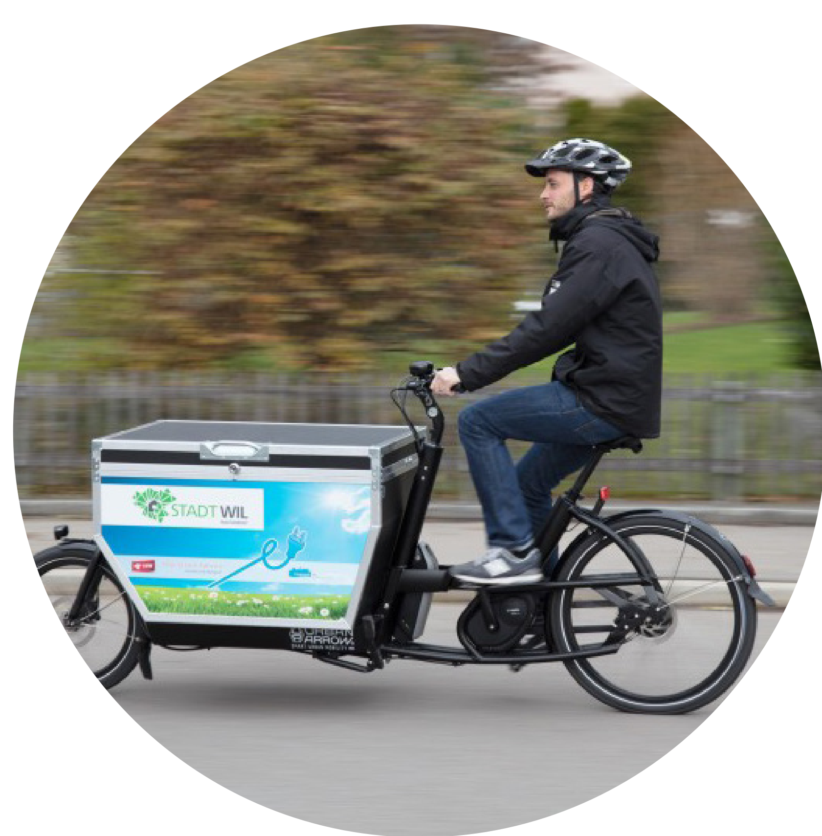
Elektrovelos als Dienstfahrzeuge einsetzen

Gesundheit, Erlebnis und soziale Nähe sprechen für den Langsamverkehr. Aber es braucht dazu durchgängige Netze, sichere Wege und generell mehr Komfort für Fussgänger und Velofahrerinnen.