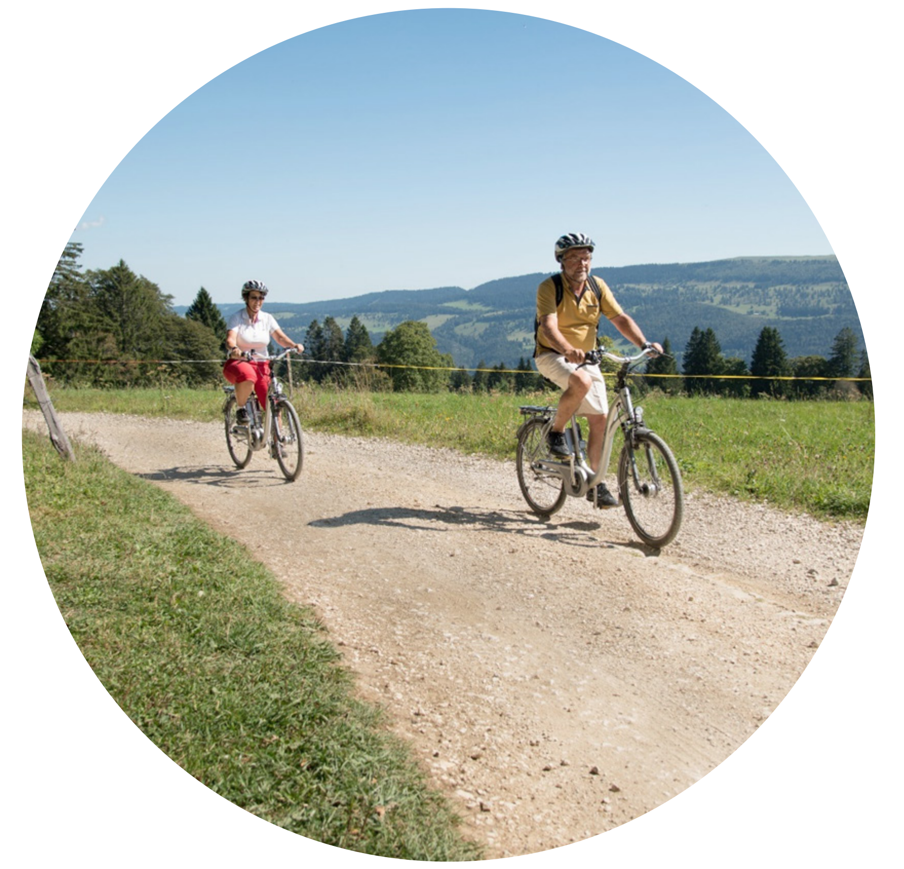
Mit (E-)Bike-Angeboten den sanften Tourismus ankurbeln