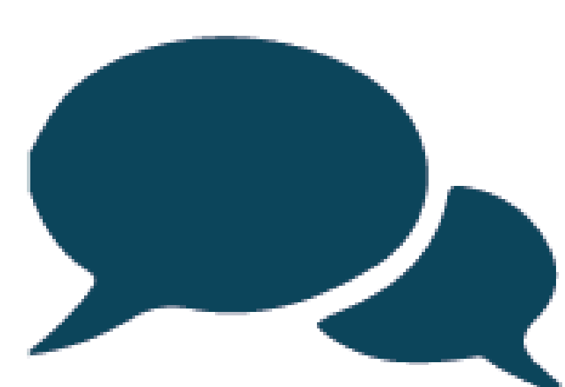
Informieren und beraten