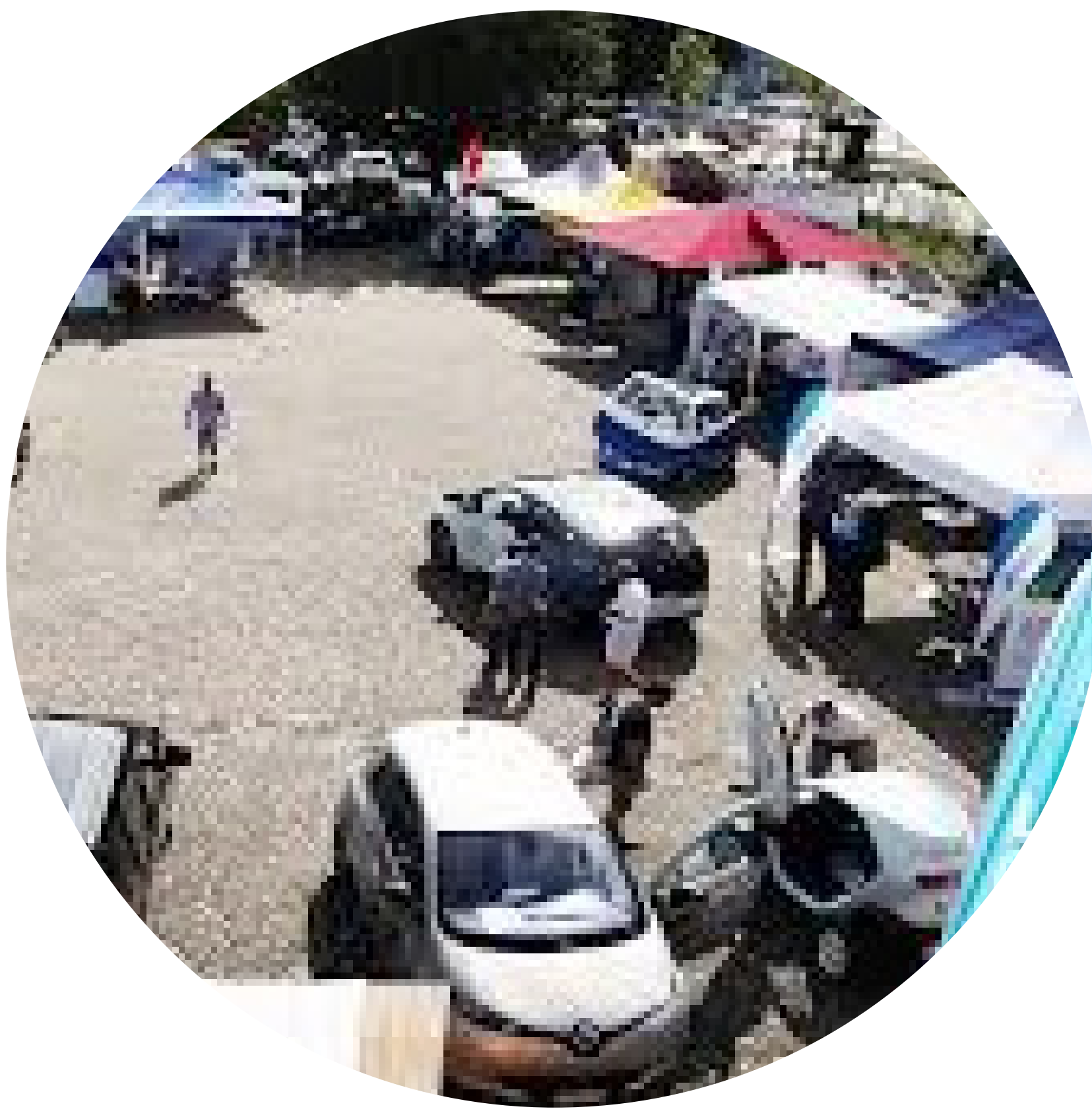
Veranstaltungen und Sensibilisierungskampagnen durchführen