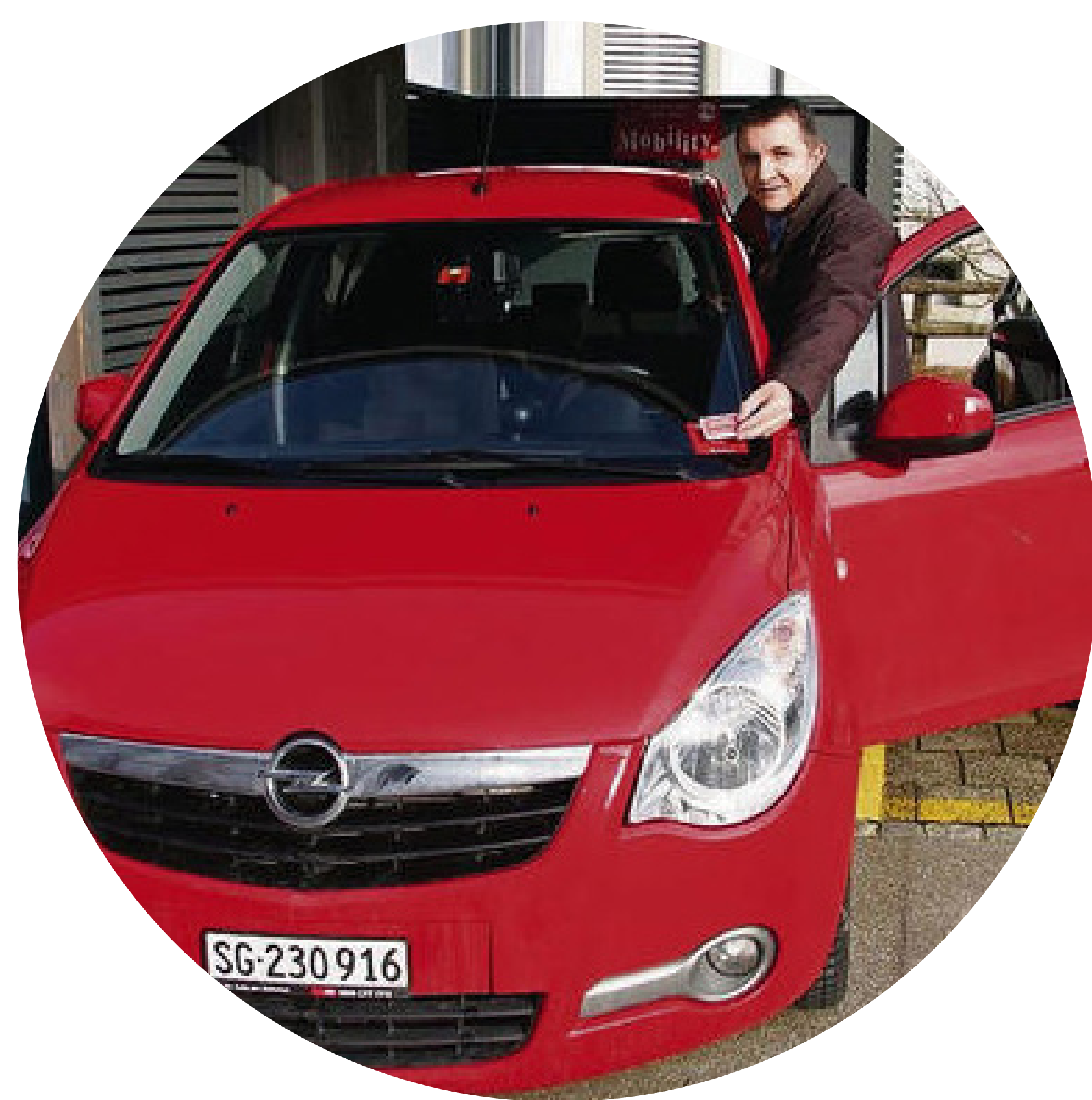
Dienstfahrzeuge mit der Bevölkerung teilen

Die Strassen sind voll, aber die Autos leer. Schon heute könnten viele Fahrten entfallen, wenn Fahrten und Fahrzeuge geteilt werden. Neue Apps und Plattformen bringen Car-, Bike- und Ride-Sharing bis in die Gemeinden.