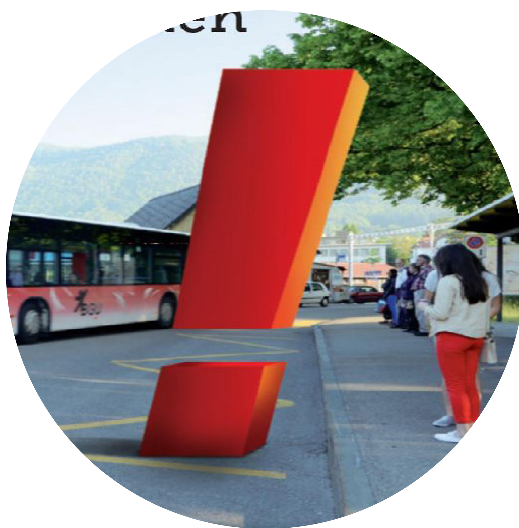
Bevölkerung über Sharing-Angebote informieren