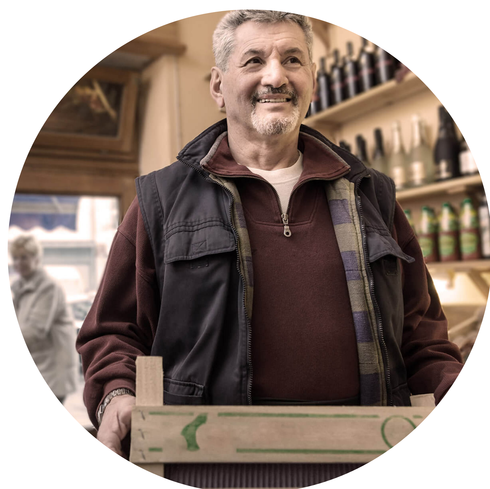
Einen digitalen Marktplatz für lokale Produkte und Dienstleistungen etablieren

Regionale Anbieter und Logistikcenter reduzieren Lieferfahrten. Hauslieferdienste per Cargo-Bike sind erprobt und bereit für Anwendungen im regionalen Kontext.