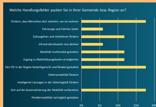
Abbildungen: Stimmungsbilder aus dem Workshop RegioMove START in Burgdorf vom 26.04.2022 mit 48 Personen

Die Ergebnisse aus dem START-Anlass mit 48 Personen sind als «Stimmungsbilder» in vier Grafiken festgehalten.